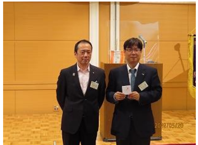
祝福 アテンダンス表彰