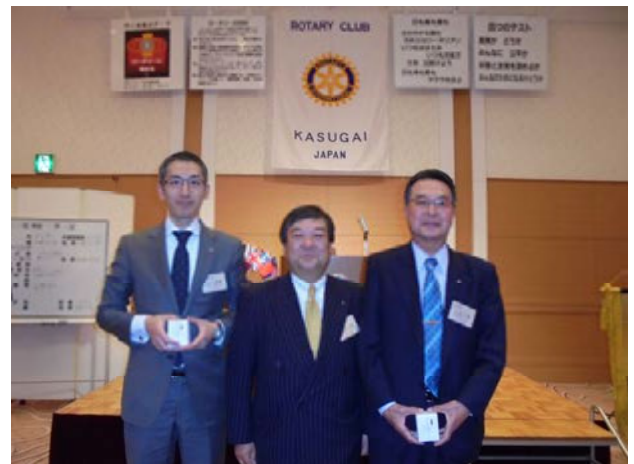
アテンダンス表彰の皆さん