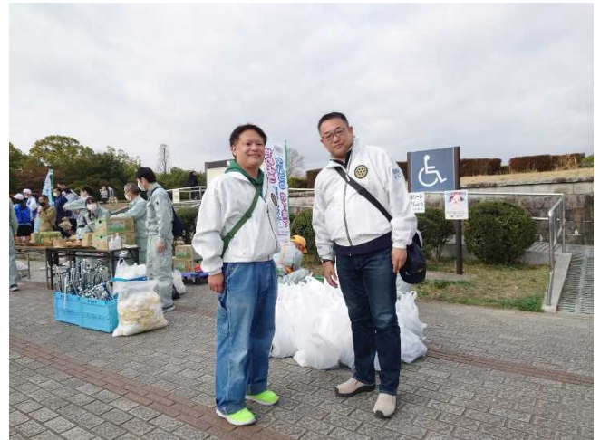
ポイ捨て・ふん害防止啓発活動 (2023. 3. 12)