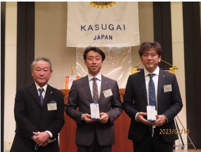
祝福 アテンダンス表彰