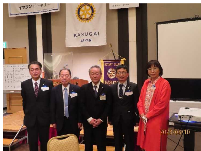
氷見 RC の皆様

ホストファミリーになるのは大変ですが、眼から鱗が落ちるようなことをいっぱい経験できます。また、言語以外のコミュニケーション能力(絵をかいたり身振り手振り)が鍛えられ、外国の人に対してあまり緊張しなくなります。そして帰国後も SNS でずっと繋がることができ、家庭内でも共通の話題ができ家族円満に役立ちます。ぜひホストファミリーを受けてみましょう。